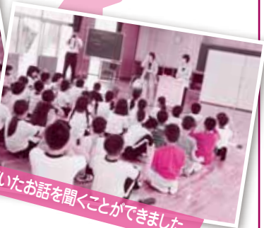
実体験に基づいたお話を聞くことができました