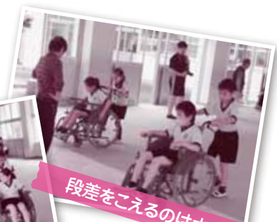
段差をこえるのは大変です