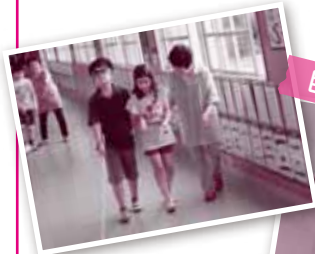
目が見えないと足がすくみます

目が見えないとはどのような感覚なのか、生活の難しさを体験し、目の不自由な方に対して声をかけて状況を伝える必要性やガイドヘルパーの存在の重要性を学びました。